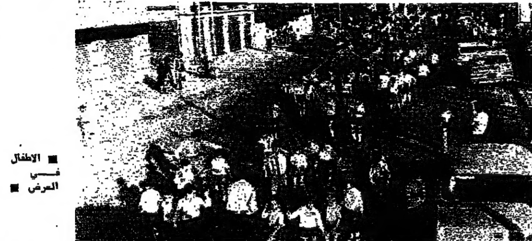
الاطفال في المرمى